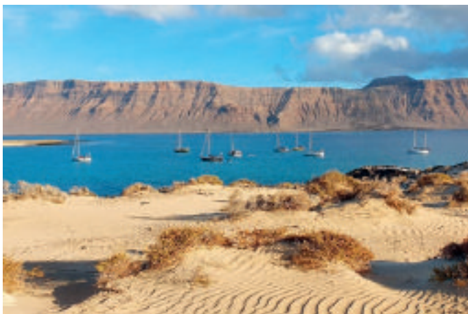
Schwarzweißbild ganz links: Tazacorte Links: Teneriffa Rechts: Eine Nacht an der frischen Luft Above left: Tazacorte Left: Tenerife This picture: A night spent outside is a special experience